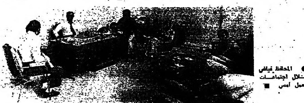
الحقن في خلال اجتماعات العمل امس

استياء من رفع تسعيرة المعالجة الصحية للمستشفيات صيدا - من مراسل «الانوار» : استاءت الاوساط الشعبية من صيدا ، من القرار الذي اتخذته تجمع اطباء صيدا والقاضي برفع تسعيرة المعالجة الصحية للمستشفيات على عمليات الاستشفاء . وقد فوجئت الاوساط الشعبية والعامة بجدارة الاطباء في صيدا الى تطبيق التسعيرة فوراً ، على رغم ان الصندوق الوطني للتأمين لم يعترف بعد بالتسعيرة الجديدة ، ولم يصرف التحويلات الا على اساس السعر القديم . حملة نظافة تبدأ اليوم في عاليه قررت لجنة مهرجانات قضاء عاليه التقيام بحملة نظافة في مدينة عاليه ابتداء من اليوم السبت . ويشارك في هذه الحملة الاهالي والشركاء والتوادي والجمعيات والمدارس في ترقى القضاء .